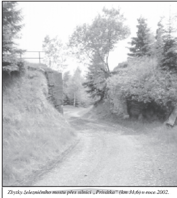
Zbytky železničního mostu přes silnici „Privátka“ (km 31,6) v roce 2002.

Ještě jednou byl učiněn pokus o obnovení provozu na trati Křimov—Reitzenhain—Marienberg. Iniciativa vzešla ze zástupců města Flöha a z občanského sdružení „Pro Bahn“.