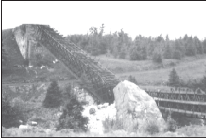
Most u Hory Sv. Šebestiána po odstřelení 18. června 1986.

Dopravní osou této oblasti se stala silnice I/7 Praha—Chomutov—státní hranice. Silnice křížovala trať Křimov—Reitzenhain dvakrát. Jednak hned za stanicí Křimov, kde byl silniční nadjezd, a jednak za bývalou zastávkou Reitzenhain v Čechách (Pohraniční), kde byl železniční nadjezd. Zrušením těchto objektů došlo u stanice Křimov k napřímení této komunikace a u bývalé zastávky „Pohraniční“ došlo ke zrušení železničního mostu, byl odtěžen násyp a silnice I/7 nebyla omezena výškou ani šířkou mostu.